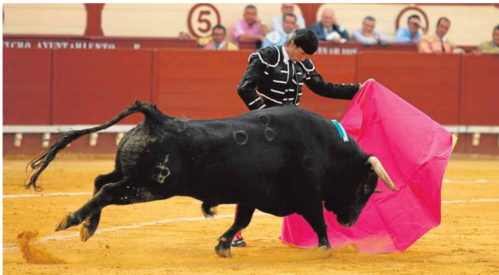
Imagen de archivo de una de las corridas de toros de la Feria de El Puerto.

Por último, Alfonso Candón añadió que el que tiene que dar las gracias a Afanas «soy yo, por la importantísima y encomiable labor que realizan en la ciudad, con la que tenemos que estar comprometidos todos». Candón recalzó igualmente que no sólo como primer edil de la ciudad, sino como portuense «está tremendamente orgulloso de la magnífica labor que realiza este colectivo». Candón le deseó suerte a los matadores y defendió «el arte de la tauromaquia y de la fiesta». Por último, Candón aprovechó la oportunidad para invitar a todos los portuenses y visitantes a asistir a la corrida de Feria, convencido de que será un «éxito imparparable».