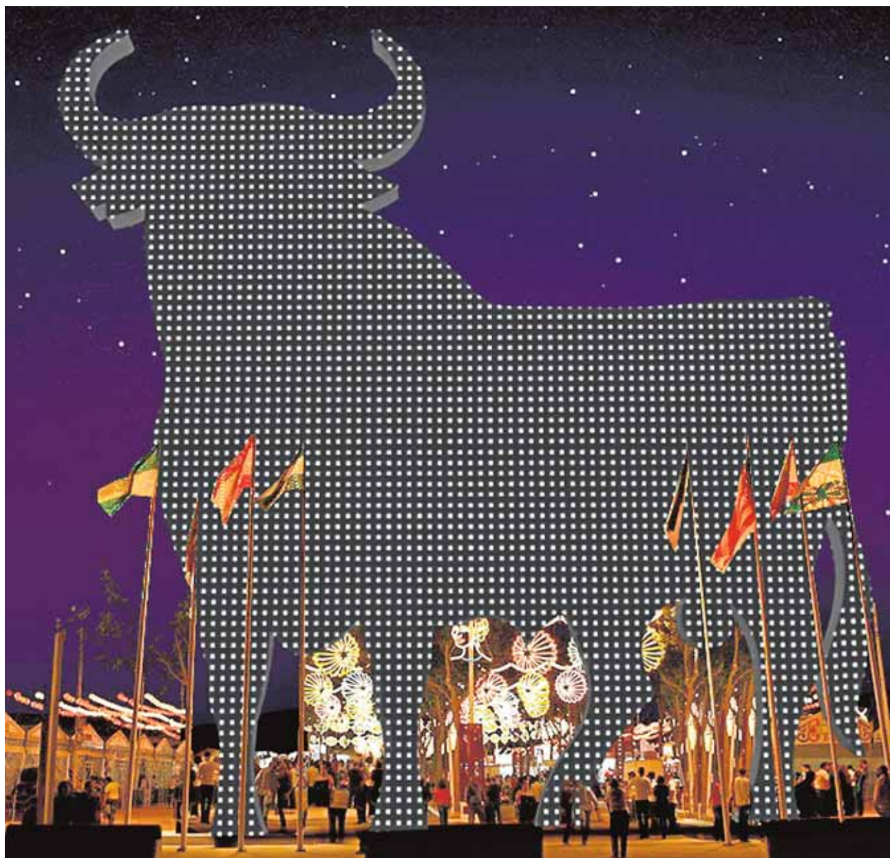
Imagen que tendrá la portada de la Feria de este año.

La silueta del toro negro presidirá el Real y será un «símbolo cultural de Es-