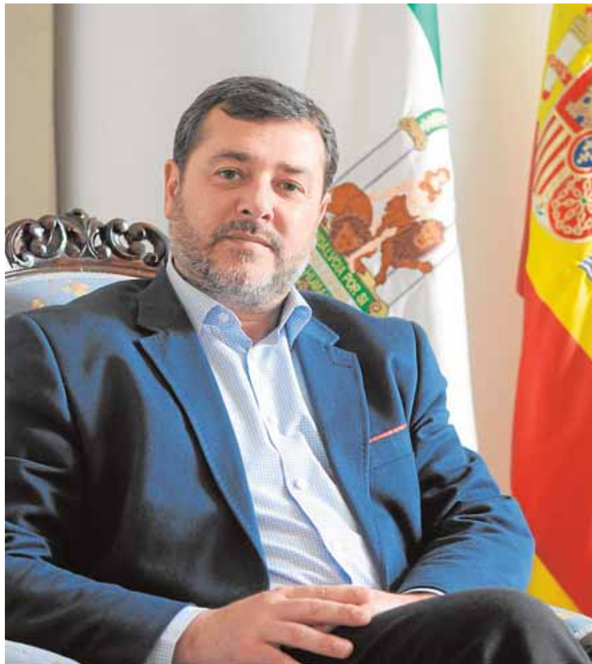
El alcalde de El Puerto, Alfonso Candón.